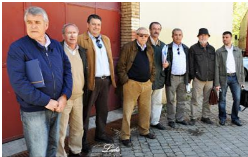
Veterinarios de "Los Califas" junto al presidente de la plaza y parte del equipo gubernativo.

Si analizamos los gastos de una corrida media de toros en una plaza de tercera (la opción más frecuente según hemos visto) comprobamos que podría organizarse por unos 65 mil euros, de los que un 65 % se va en los emolumentos a las figuras, el 12 % para abonar el ganado, un 9% de Seguros Sociales, un 3,5% servicios médicos y ambulancias, un 3% pago de tasas e impuestos, 3% cuadra de caballos y otro 3% en gastos varios (seguridad, taquillas, porteros, areneros, banderillas, músicos, cartelería...).